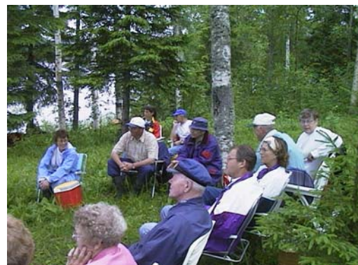
Intresserade deltagare på årsmötet