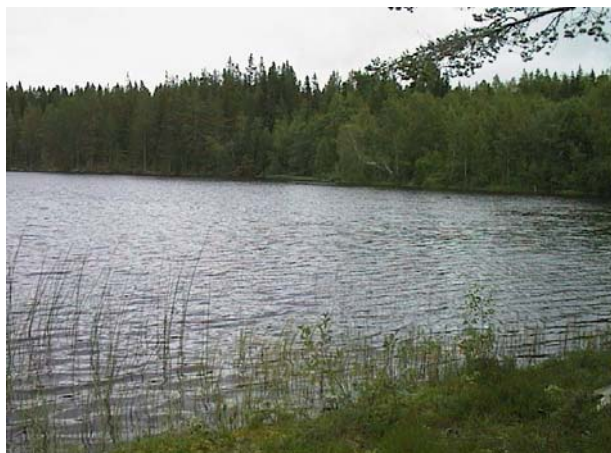
Kallbäckstjärnens mörka vatten